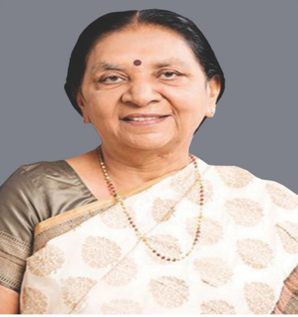
श्रीमती आनंदीबेन पटेल माननीया कुलाधिपति, उत्तर प्रदेश