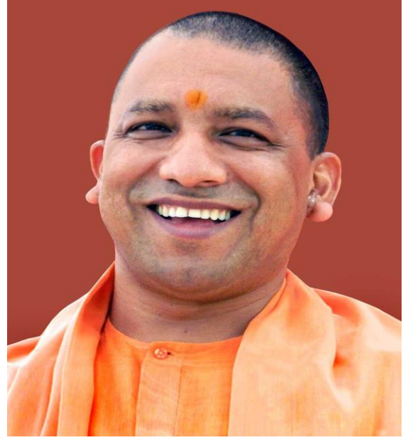
श्री योगी आदित्यनाथ जी माननीय मुख्यमंत्री, उत्तर प्रदेश