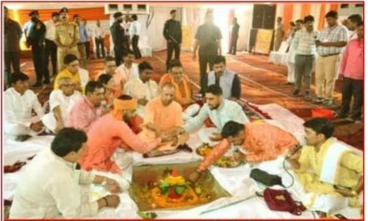
भूमि पूजन करते हुये माननीय मुख्यमंत्री श्री योगी आदित्यनाथ जी