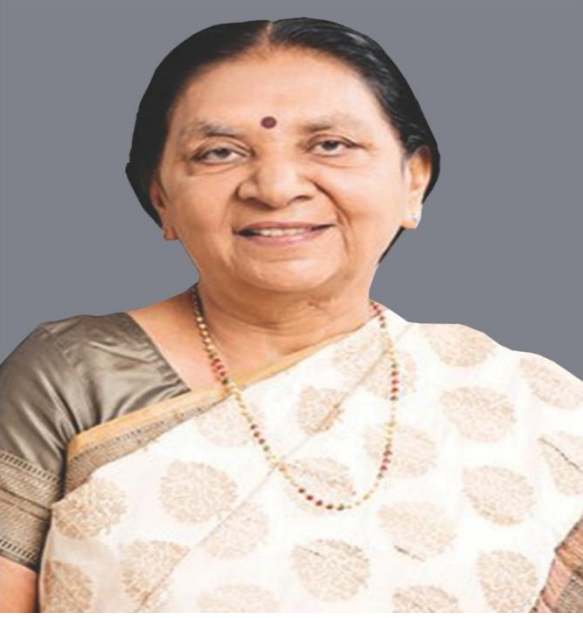
श्रीमती आनंदीबेन पटेल माननीया कुलाधिपति, उत्तर प्रदेश