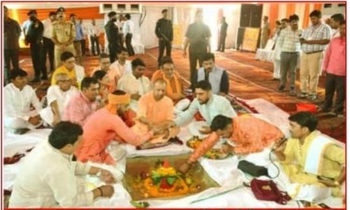
भूमि पूजन करते हुये माननीय मुख्यमंत्री श्री योगी आदित्यनाथ जी