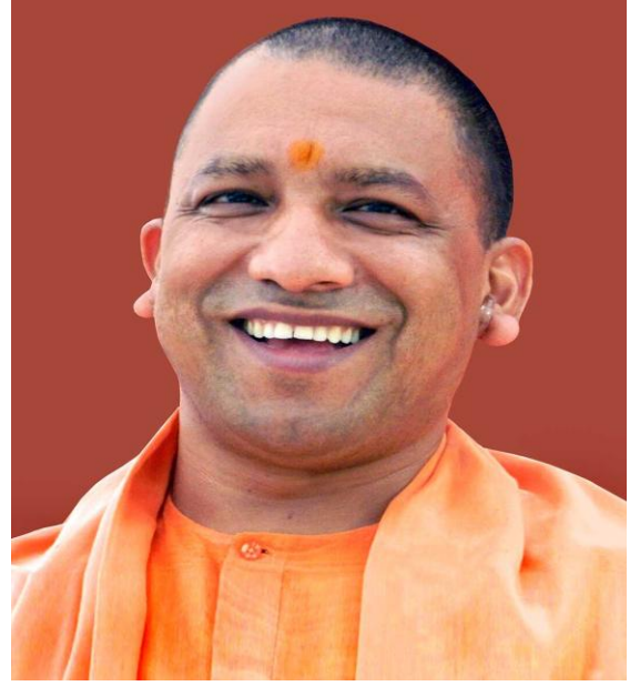
श्री योगी आदित्यनाथ जी माननीय मुख्यमन्त्री, उत्तर प्रदेश