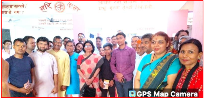
GPS Map Camera