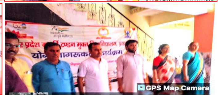
GPS Map Camera