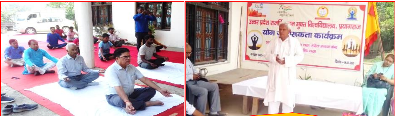
विश्वविद्यालय के प्रयासों की सराहना एवं विश्वविद्यालय के प्रति कृतज्ञता व्यक्त करते हुए लेहरा तिवारीपुर गाँव के प्रधान