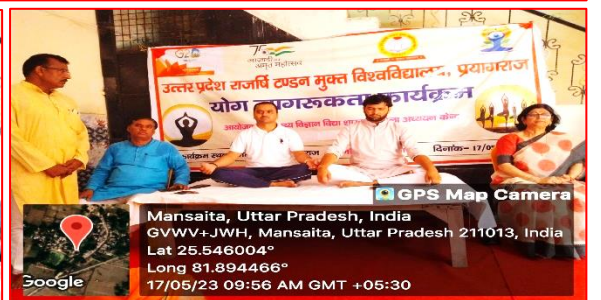
GPS Map Camera

Mansaita, Uttar Pradesh, India GVVW+JWH, Mansaita, Uttar Pradesh 211013, India Lat 25.546004° Long 81.894466° 17/05/23 09:56 AM GMT +05:30