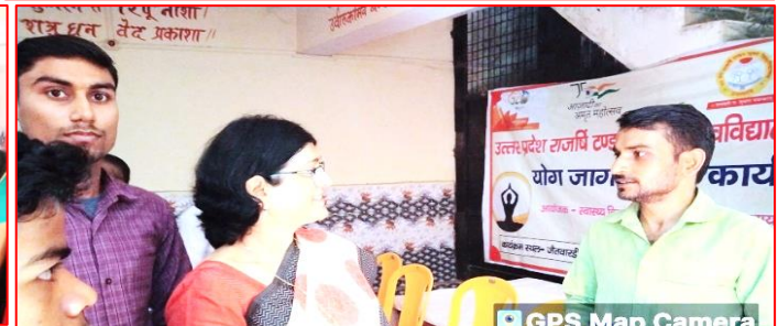
GPS Map Camera